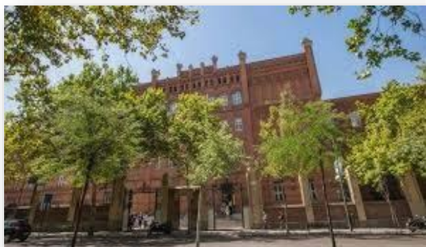
Campus Alberto Aguilera 23

Si alguna universidad va a retrasarse o tiene dificultad para llegar a tiempo antes del cierre de inscripciones, puede gestionar su inscripción hasta una hora antes del comienzo de competición, siempre y cuando se haya comunicado previamente de manera motivada a la organización enviando un correo a: rperez@comillas.edu antes del 3 de abril.