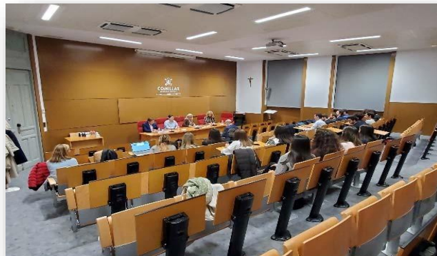
Aula García Polavieja (Reunión técnica)