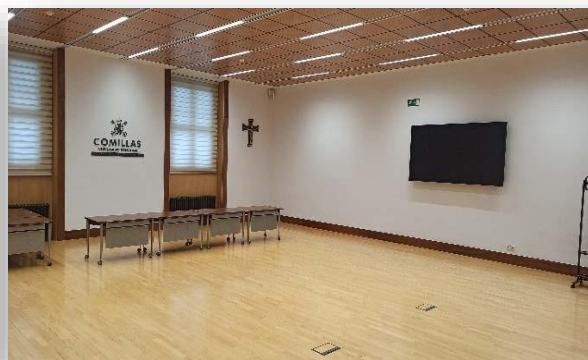
Sala de recepción (Acreditaciones)