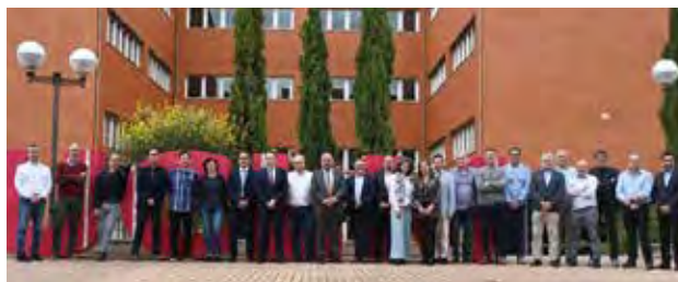
Foto VTED.2. Reunión Comisión Sectorial de Transformación Digital G9

dad, eficacia y eficiencia de las universidades españolas en el ámbito de las tecnologías de las TIC.