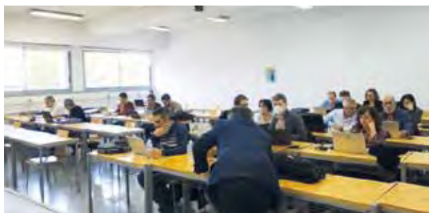
Foto VTED.1. Reunión II Jornada CertiDigital

actores clave en el campo de las credenciales digitales en la educación. Las jornadas se centraron en la preparación de las universidades para emitir y gestionar estas credenciales, así como en cómo se pueden integrar con las credenciales digitales universitarias EDC/Europass. Además, se llevaron a cabo sesiones de formación que profundizaron en conceptos clave y prácticas recomendadas en el diseño de las credenciales digitales. La participación activa y la colaboración entre las universidades participantes fueron una parte integral del evento, lo que indica un enfoque colectivo hacia la digitalización de la educación superior. En la [Foto VTED.1] se muestra una de las actividades de trabajo desarrolladas en las jornadas.