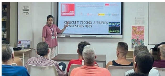
Foto VPC.9. III Edición del programa de la UCLM: «Divulgación en prisión: una ventana abierta a la ciencia»