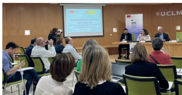
Foto VPC.2. Jornada Acciones Marie Skłodowska-Curie MSCA 2024 Doctoral Networks y Postdoctoral Fellowships en la UCLM