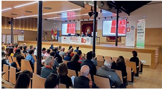
Foto VPC.4. Jornadas doctorales

Este curso académico concurrió un total de 78 doctores a la Convocatoria del Premio Extraordinario de Doctorado 2022-2023, concediéndose un total de 25 premios extraordinarios distribuidos en las cinco ramas de conocimiento: