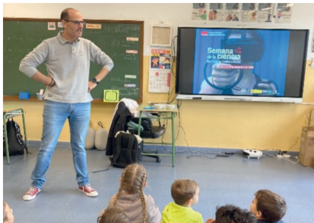
Foto VPC.6. Semana de la Ciencia 2023