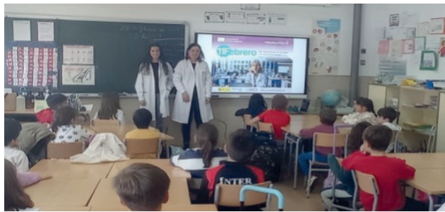
Foto VPC.7. 11F-Entrevista a una científica en el aula