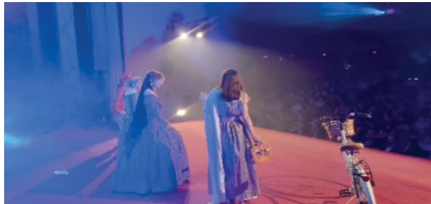
Foto VPC.8. 11F-Día Internacional de la mujer y la niña en la ciencia