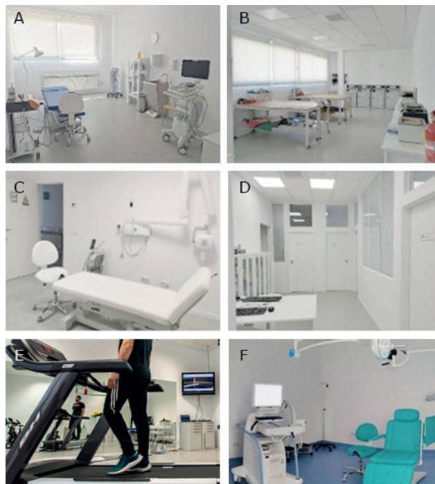
Fotos VCCS.4: Sala podología física (A), sala de ortopodología (B), sala de radiodiagnóstico (C), sala de exploración quiropodología (D), una de las salas de exploración biomecánica (E), sala quirúrgica (F).

Se ha participado en la coordinación con el programa UCLM RURAL cuyo objeto es permitir a los estudiantes completar su formación mediante el desarrollo de prácticas externas remuneradas, curriculares y extra-