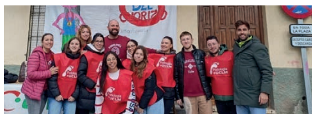
Foto VCCS.5. Participación de los estudiantes en prácticas en el Centro de Atención Podológica como equipo sanitario en la «Carrera Popular del Chorizo», Castillo de Bayuela, Talavera de la Reina

curriculares, en empresas, instituciones y asociaciones del medio rural y de localidades poco pobladas de Castilla-La Mancha.