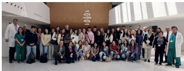
Foto VCCS.1. Visita a las instalaciones del Hospital Universitario de Toledo

Con motivo de la planificación del próximo curso académico 2024-2025, en el mes de junio se publica la licitación para la adquisición de material informático y material de exploración y simulación clínica para la Unidad Docente de medicina en el CHUT.