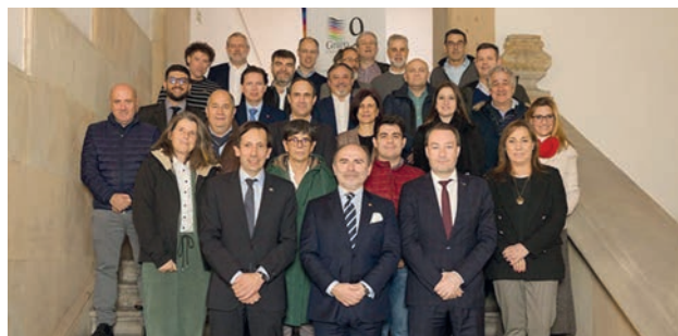
Foto VTED.1. Reunión Comisión Sectorial de Transformación Digital G9

El VTED ha trabajado activamente en la promoción y desarrollo de la cultura digital en la Universidad. La diversidad de las iniciativas llevadas a cabo refleja su compromiso