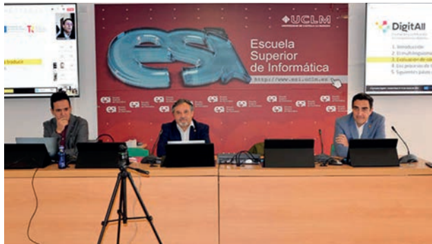
Foto VTED.3. II Jornadas DigitALL, 2024. ESI, Albacete

aprender aspectos relacionados, tanto con la irrupción de la Inteligencia Artificial, así como con cualquier actividad relacionada con el Gobierno del Dato en las universidades.