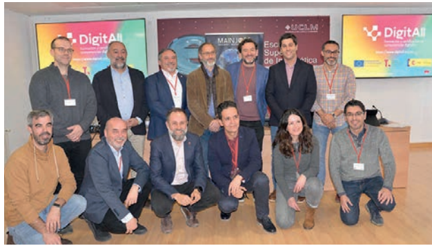
Foto VTED.2. I Jornada DigitALL, 2023. ESI, Albacete

I Jornada Grupo de Trabajo Inteligencia Artificial y Gobierno del Dato de CRUE Digitalización , que tuvo lugar el 12 de marzo 2024 en la Escuela Superior de Informática de la UCLM en el campus de Ciudad Real. El objetivo principal de esta jornada fue crear un grupo de trabajo, en la sectorial de CRUE Digitalización, para compartir, explorar y