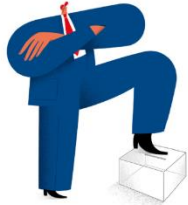
La huella global de Trump